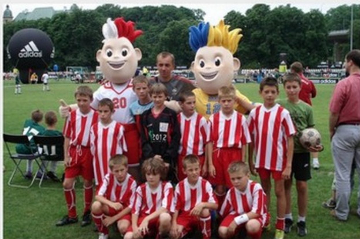
Akademia Piłkarska Orliki przy Szkole Podstawowej w Jeruzalu

Ponadto na terenie gminy Mrozy od 1999r. działa Akademia Piłkarska Orlik przy Szkole Podstawowej w Jeruzalu, która oprócz kształcenia kadry piłkarskiej w 2011r. dała szansę młodzieży na uczestnictwo w takich turniejach, jak: