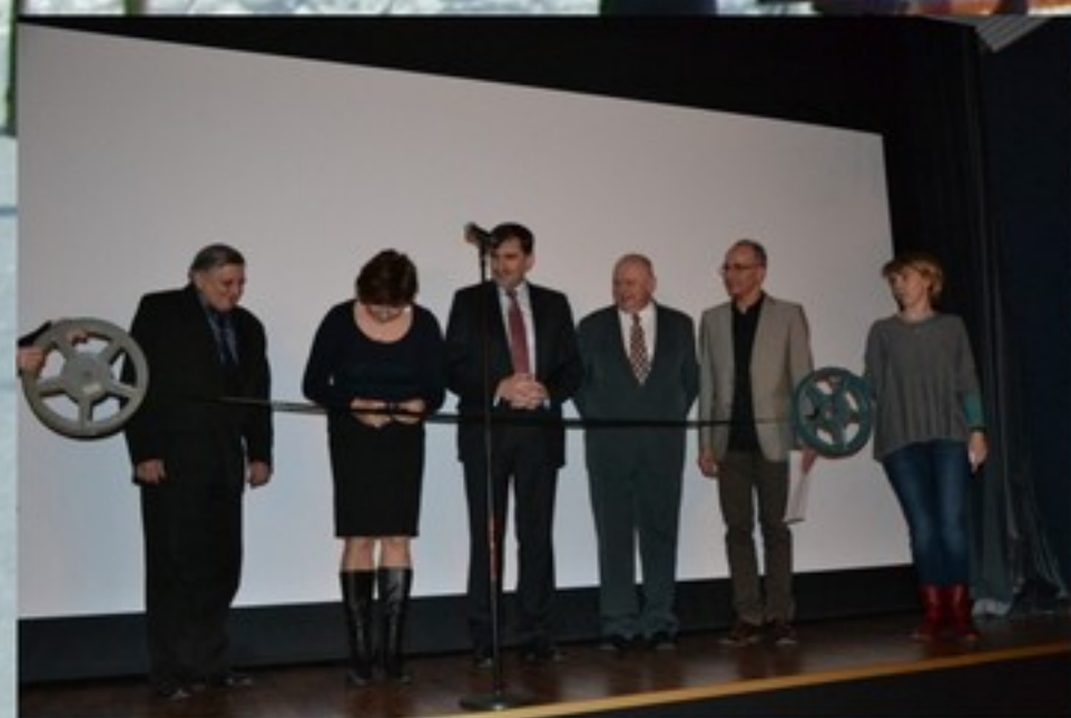
Otwarcie kina cyfrowego, str. KM