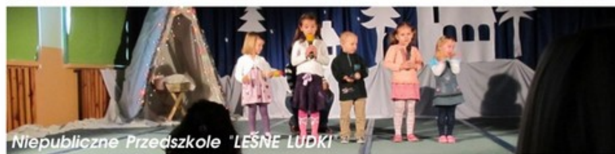
Niepubliczne Przedszkole „LEŚNE LUDKI”