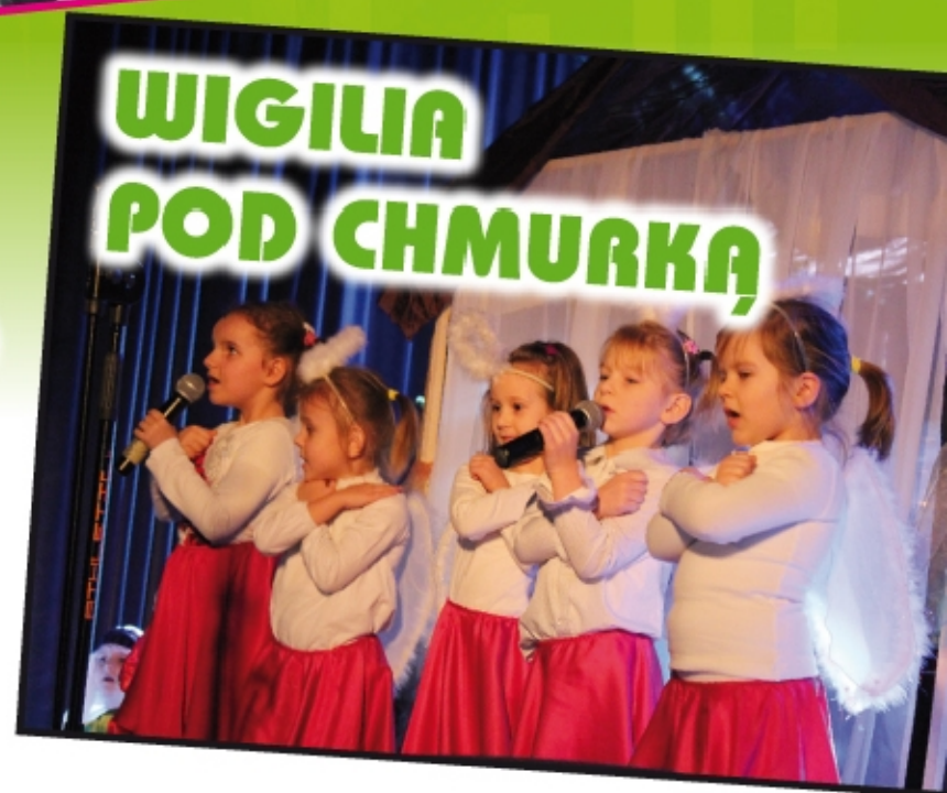
WIGILIA POD CHMURKĄ