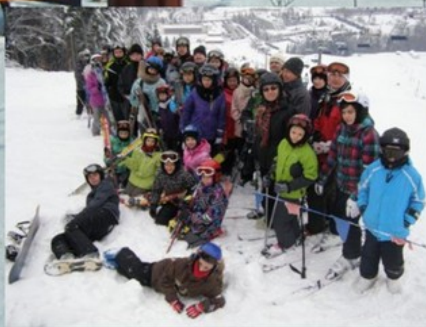
Zimowe szaleństwo, str. 21