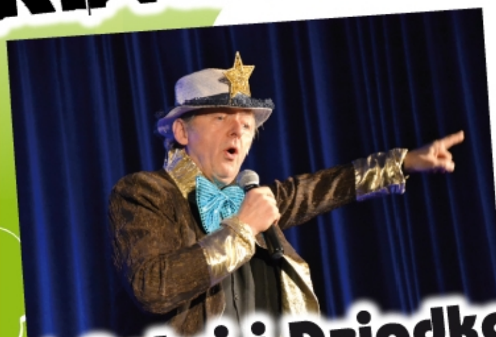
Dzień Babci i Dziadka