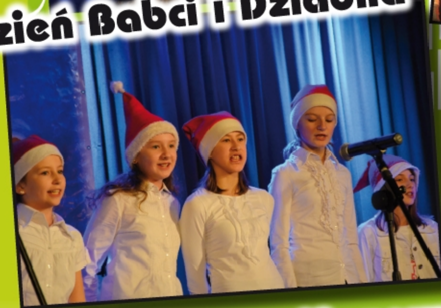
Kołodowe Serce Mazowsza V Festiwal Kołęd i Pastoralek