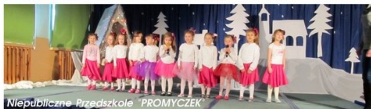
Niepubliczne Przedszkole „PROMYCZEK”