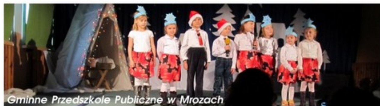
Gminne Przedszkole Publiczne w Mrozach