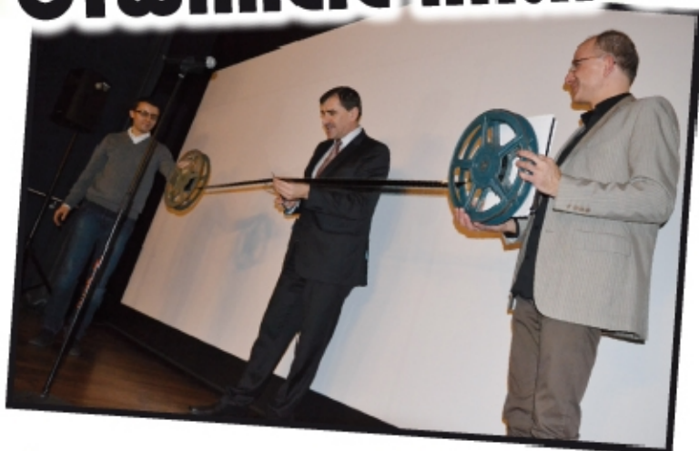
OTWARCIE KINA CYFROWEGO