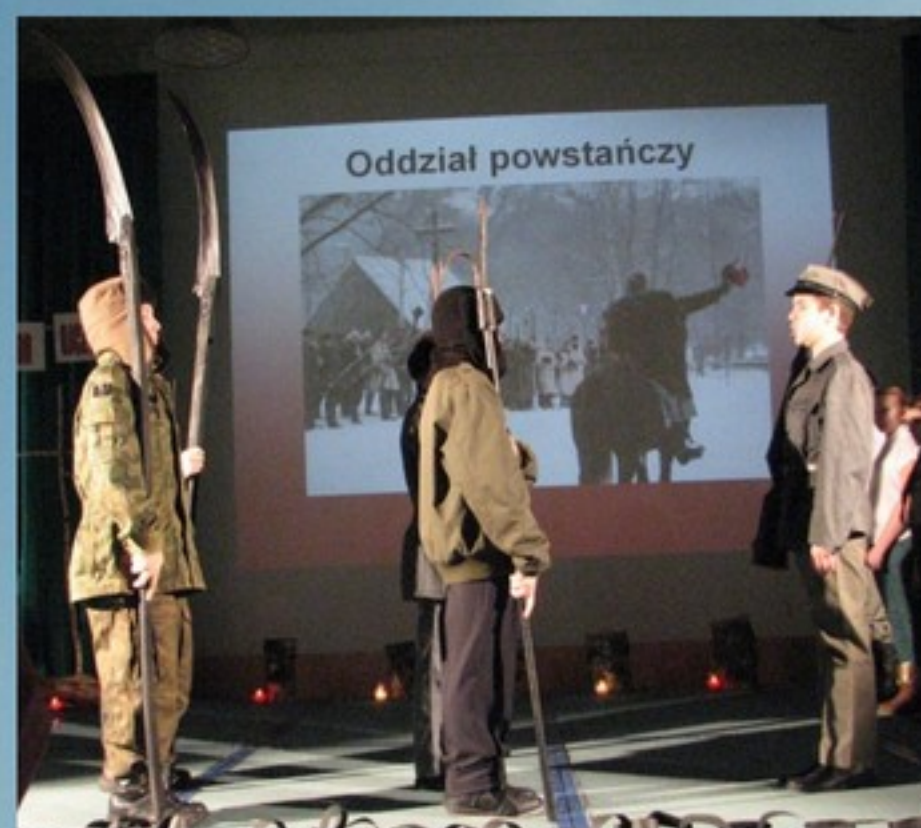
Święto patrona szkoły, str. 16