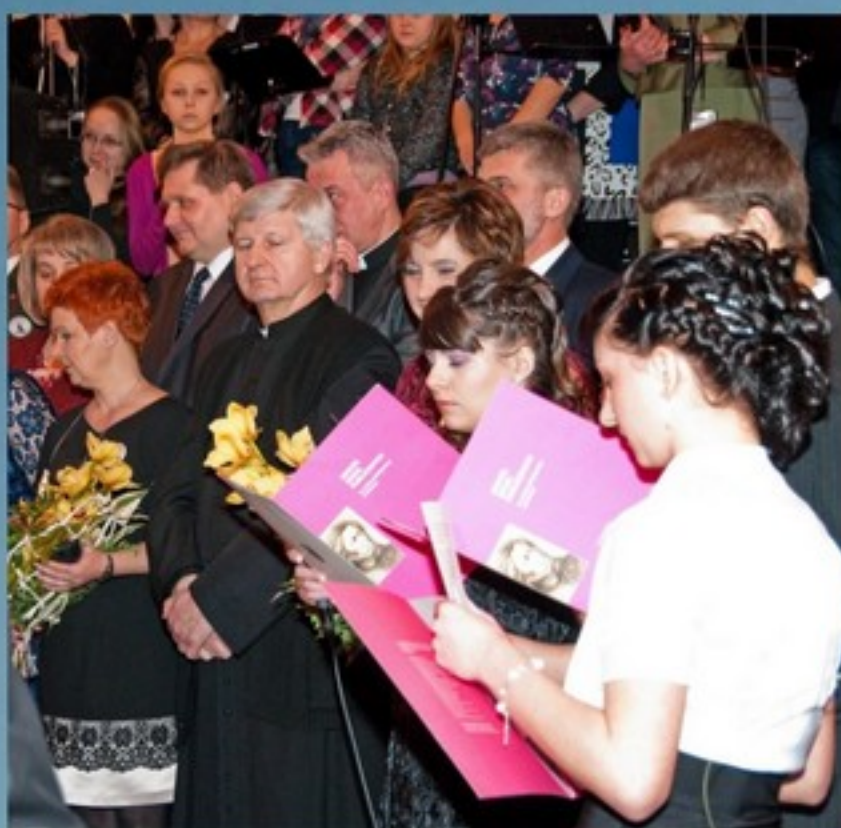
Jedyny taki bal..., str. 12

Bezpłatny Biuletyn Informacyjny Gminy Mrozy - Dwumiesięcznik