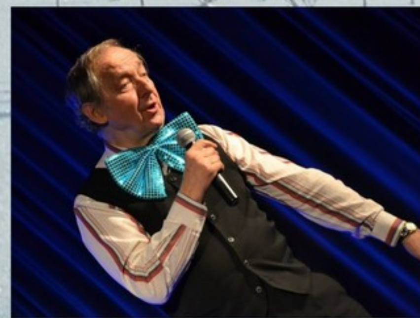
Dzień Babci i Dziadka, str. 14, 16, 17, 18, 19, 20 + KM