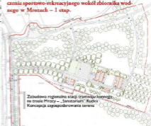
Zabudowa regionalna stacji tramwaju konnego na trasie Mrozy – „Sanatorium” Rudka Koncepcja zagospodarowania terenu

Realizacja ww. projektów stanowi kolejny ważny krok w tworzeniu interesującej oferty turystycznej dla odwiedzających naszą gminę. Projekty stanowią kontynuację innych zrealizowanych operacji z udziałem środków Unii Europejskiej: wystarczy wymienić kilka zrealizowanych w ostatnim czasie: Remont kolekcji tramwaju konnego Mrozy – „Sanatorium” Rudka czy Urządzenie otoczenia sportowo-rekreacyjnego wokół zbiornika wodnego w Mrozach – I etap.