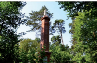
Pomnik św. Antoniego

Cały projektowany kompleks składać się będzie ze stacji i peronu odwarzanej linii tramwaju konnego oraz wiejskiej zagrody wraz z sadem. Całości dopełni układ komunikacyjny, w tym alejki piaseczne i placówki w formie bulwaru położonego nad pobliską rzeką Witówką – Tytrwą.