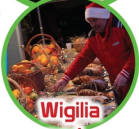
Wigilia pod chmurką