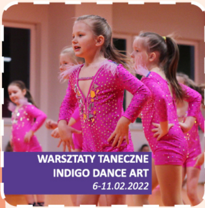
WARSZTATY TANECZNE INDIGO DANCE ART 6-11.02.2022