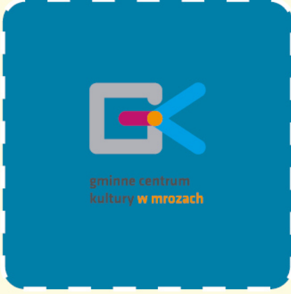
gminne centrum kultury w mrozach