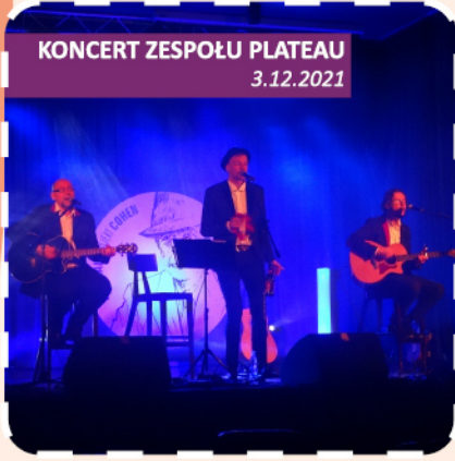
KONCERT ZESPOŁU PLATEAU 3.12.2021