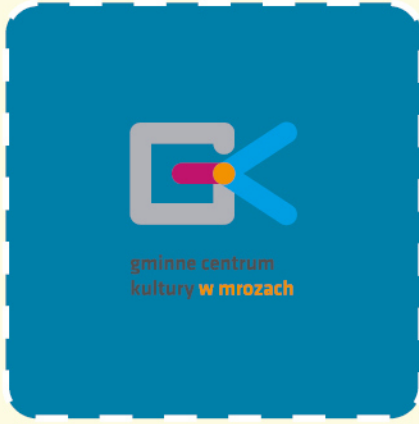
gminne centrum kultury w mrozach