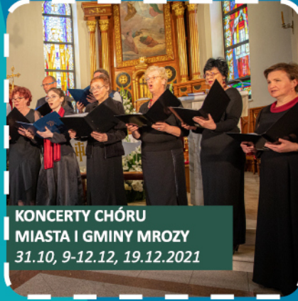
KONCERTY CHÓRU MIASTA I GMINY MROZY 31.10, 9-12.12, 19.12.2021