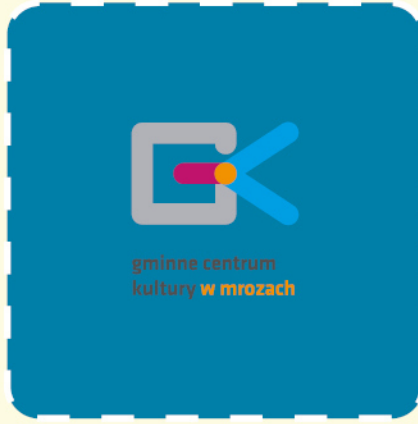
gminne centrum kultury w mrozach