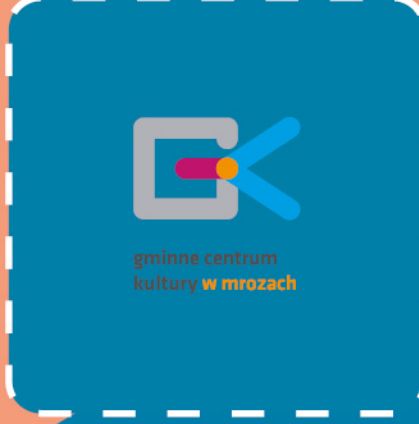
gminne centrum kultury w mrozach