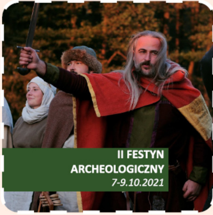
II FESTYN ARCHEOLOGICZNY 7-9.10.2021