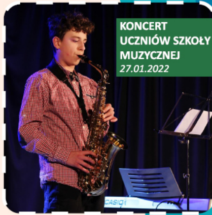
KONCERT UCZNIÓW SZKOŁY MUZYCZNEJ 27.01.2022