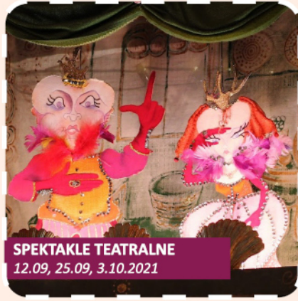
SPEKTAKLE TEATRALNE 12.09, 25.09, 3.10.2021