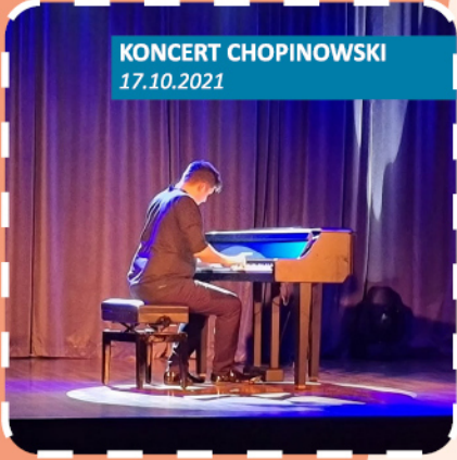
KONCERT CHOPINOWSKI 17.10.2021