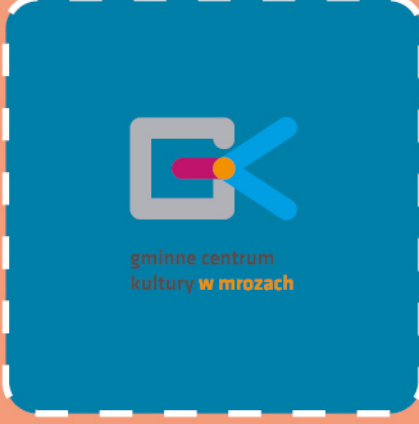
gminne centrum kultury w mrozach