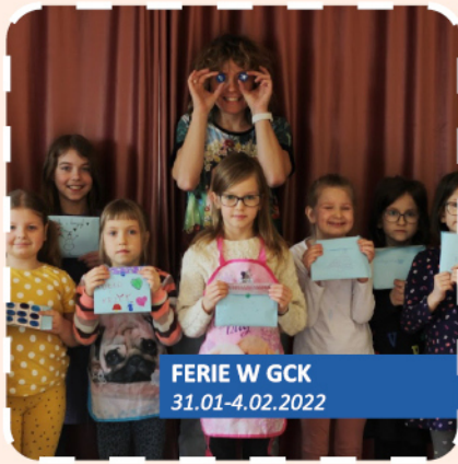
FERIE W GCK 31.01-4.02.2022