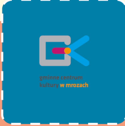
gminne centrum kultury w mrozach