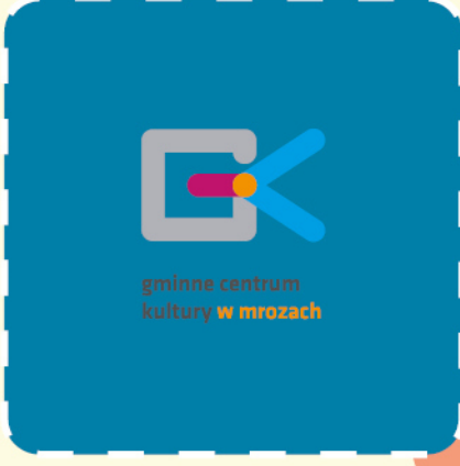
gminne centrum kultury w mrozach