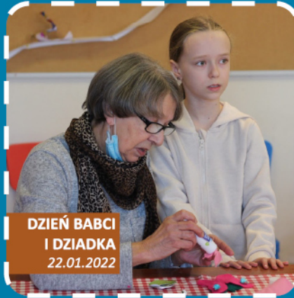
DZIEŃ BABCI I DZIADKA 22.01.2022