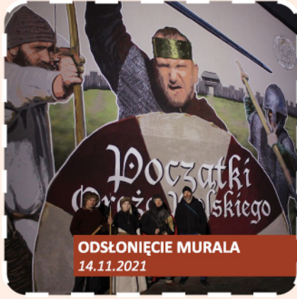
ODŚLONIĘCIE MURALA 14.11.2021