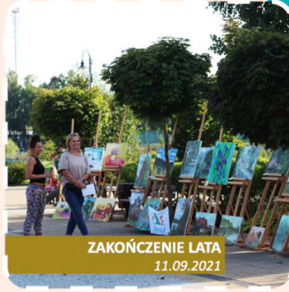
ZAKOŃCZENIE LATA 11.09.2021