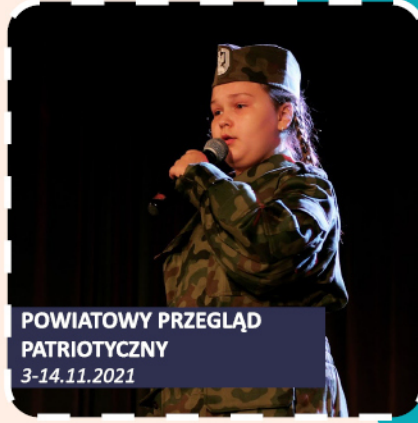
POWIATOWY PRZEGLĄD PATRIOTYCZNY 3-14.11.2021