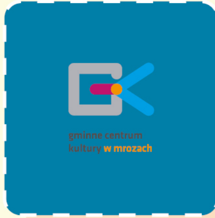
gminne centrum kultury w mrozach