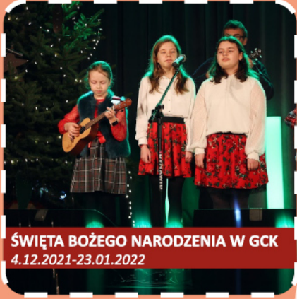
ŚWIĘTA BOŻEGO NARODZENIA W GCK 4.12.2021-23.01.2022