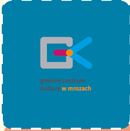
gminne centrum kultury w mrozach