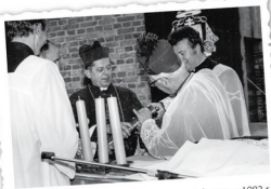
Uroczystość wmurowania kamienia węgielnego w 1983 r.