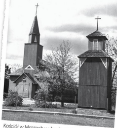
Kościół w Mrozach wybudowany w 1930 r.

Dokładnie 1 kwietnia mija 85 lat od czasu erygowania parafii w Mrozach. Historia tej parafii w porównaniu chociażby z parafią w Jeruzalu czy w Kuflewie, która w zeszłym roku obchodziła 500-lecie swojego istnienia, jest dość krótka. Jest też zdecydowanie inna, zwłaszcza gdy spojrzymy na okoliczności jej powstania. O ile w XVI wieku o utworzeniu parafii w danym miejscu decydowała skuteczność wpływu właścicieli ziemskich, to XX wiek, a przede wszystkim okres tak zwanego dwudziestolecia międzywojennego, przy tworzeniu nowych ośrodków parafialnych kazał brać pod uwagę inne argumenty. Jakże? To dobrze widać na przykładzie Mrozów.