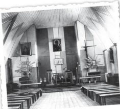
Wystrój wnętrza pierwszego kościoła