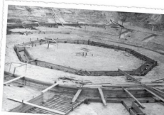
Fundamenty murowanego kościoła 1981 r.