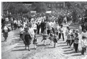
Boże Ciało 1988 r.