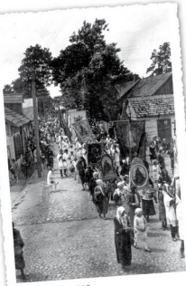
Boże Ciało 1938 r.

Sprawa Mrozów musiała być jemu z pewnością przedstawiana, choć nie odbyła się w tej kwestii żadna oficjalna wizyta. Kardynał prawdopodobnie tylko jeden raz odwiedził Mrozy i to przejazdem, gdy 26 czerwca 1920 r. wracał z kilkunastodniowej wizyty kanonicznej we wschodnich