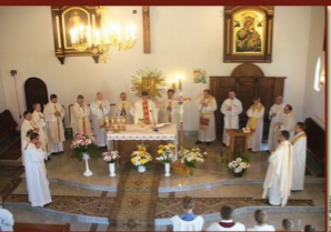
Nr. K. Spisowa