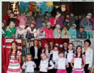
Oprac. Joanna Ługowska

23 kwietnia obchodzony jest Światowy Dzień Książki i Praw Autorskich. Z tej okazji zaprosiliśmy najmłodszych czytelników na wspólne czytanie bajek, malowanie i tworzenie własnej księżki.