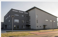
Wielofunkcyjna Hala Sportowa w Mrozach