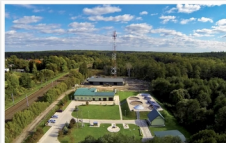
Zakład Gospodarki Komunalnej i Oczyszczalnia Ścieków w Mrozach