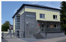
Gminna Biblioteka Publiczna w Mrozach