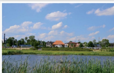
Park im. Piotra Starosty w Mrozach