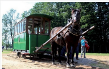
Tramwaj Konny Mrozy - Rudka