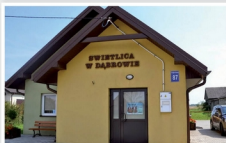
Świetlica w Dąbrowie