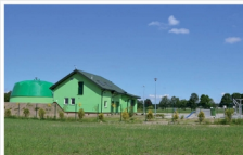
Oczyszczalnia Ścieków w Jeruzalu