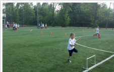
Boisko wielofunkcyjne „Moje Boisko – Orlik 2012” przy Zespole Szkół w Mrozach