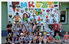
Wakacje z Gminnym Centrum Kultury w Mrozach