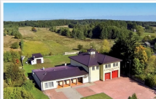
Ochotnicza Straż Pożarna w Grodzisku