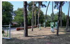
Siłownia zewnętrzna przy ul. Armii Krajowej w Mrozach