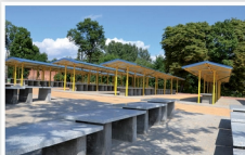
Targowisko w Mrozach