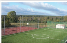
Boisko wielofunkcyjne „Moje Boisko – Orlik 2012” przy Szkole Podstawowej w Grodzisku