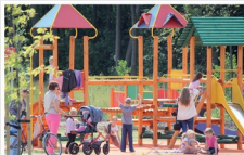
Plac zabaw przy Parku im. Piotra Starosty w Mrozach