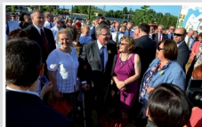
Wizyta Pary Prezydenckiej w Mrozach