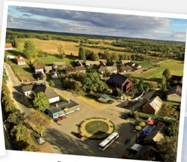
Rynek w Jeruzalu – Plan filmowy „Ranczo”