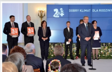
Główna nagroda w konkursie Dobry Klimat dla Rodziny