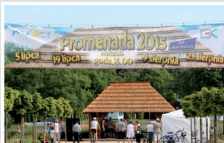
Koncertы promenade w Parku im. Piotra Starosty w Mrozach