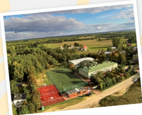
Zespół Szkół w Jeruzalu