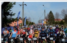
Mazovia MTB Marathon