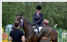
Majówka z Utanami