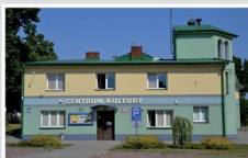
Gminne Centrum Kultury w Mrozach