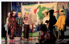
Wojewódzki Przegląd Twórczości Artystycznej Kulturomaniak