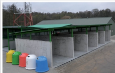
Punkt Selektywnej Zbiórki Odpadów Komunalnych w Mrozach