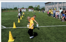
Gminna Mini Olimpiada Przedszkole i klas I-III