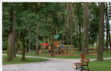
Plac zabaw przy ul. Licealnej w Mrozach