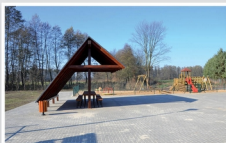
Punkt postoju turystów w Łukówcu