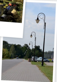
Mrozy ul. Graniczna