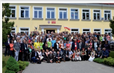
Ogólnopolski Zjazd Opiekunów Szkolnych Pracowni Internetowych w Mrozach