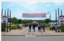
Moto Serce Mrozy