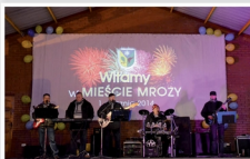
Nadanie praw miejskich