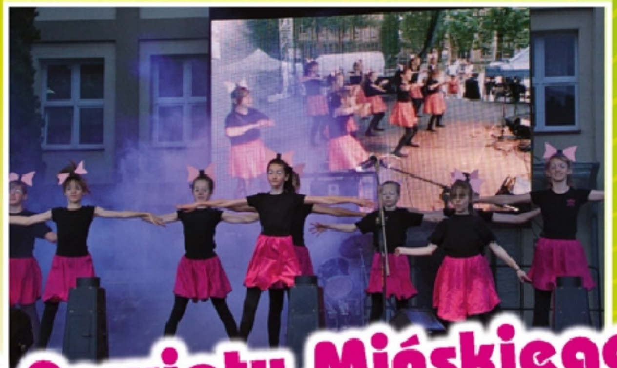
Dni Powiatu Mińskiego