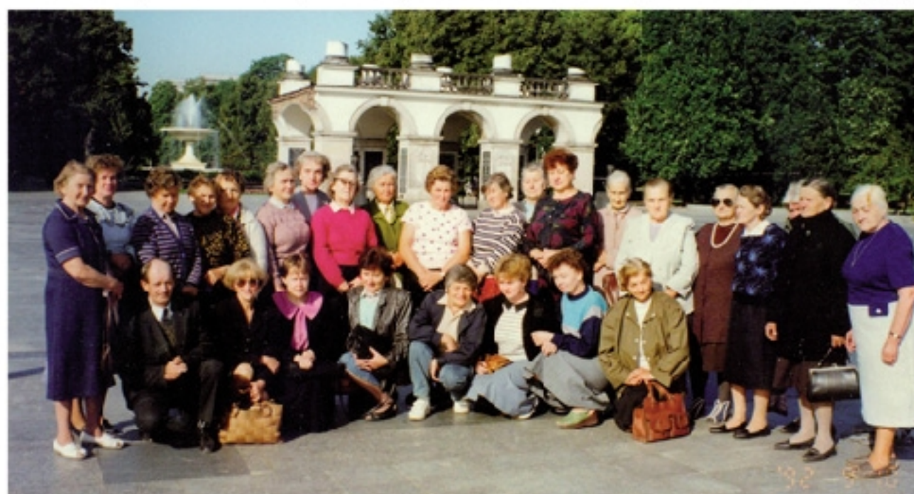
Wycieczka do Warszawy 10 IX 1992

Koło Polskiego Związku Emerytów, Rencistów i Inwalidów w Mrozach utworzono 16 października 1977 roku. Również rok później, w pierwszą rocznicę istnienia Koła, dokonano wyboru Arcybiskupa Krakowskiego Karola Wojtyły