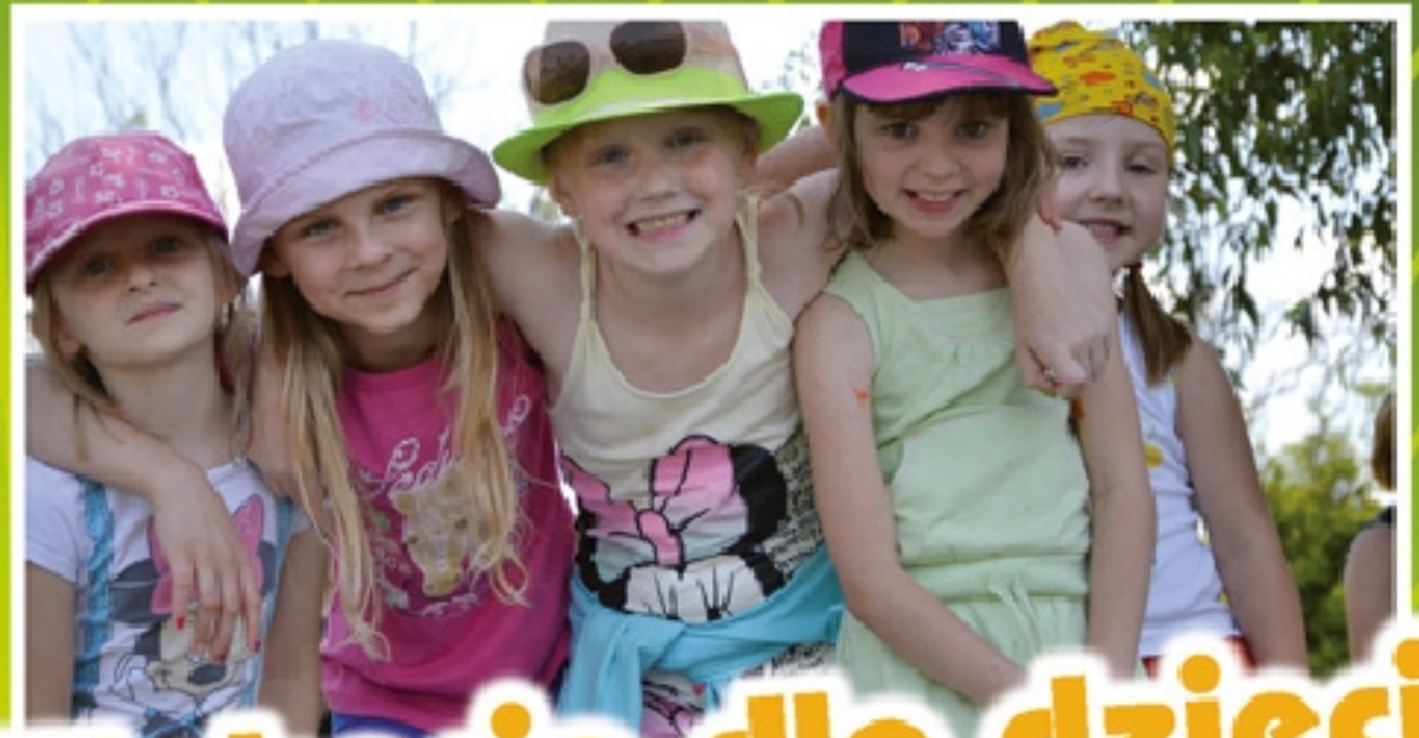
Wakacje dla dzieci