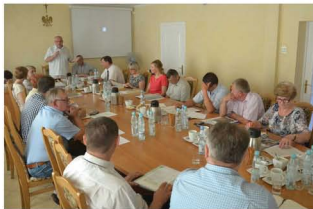
XVIII sesja Rady Miejskiej