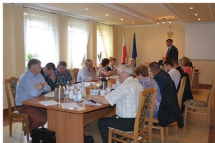
XVII sesja Rady Miejskiej