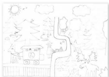
I miejsce: Szymon Serwatka