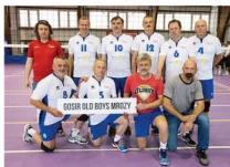
GOSIR Oldboys Mrozy +50