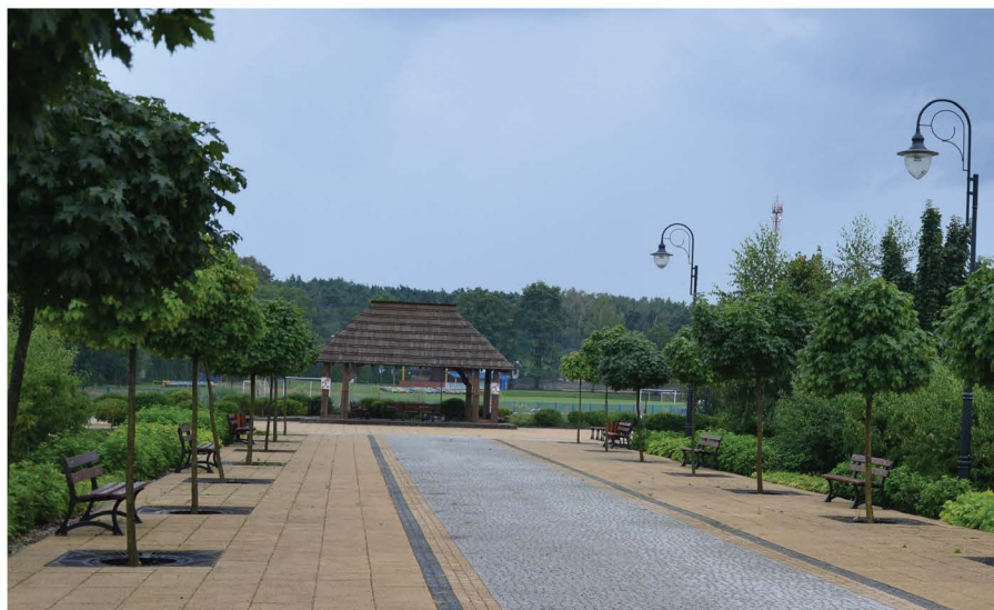
Park im. Piotra Starosty w Mrozach

Środki unijne stały się także wsparciem dla rewitalizacji i przeobrażenia naszej przestrzeni publicznej. W wyniku realizacji dofinansowanego ze środków finansowych UE zadania inwestycyjnego w miejscu terenów przemysłowych, na którym znajdowały się stare magazyny, gmina urządziła ogólnodostępną, publiczną infrastrukturę rekreacyjną. Został wybudowany retencyjny zbiornik wodny, a następnie powstał park nad wodą, który otrzymał nazwę Parku im. Piotra Starosty w Mrozach. W tym roku planowane jest kolejne uzupełnienie i rozbudowa istniejącej infrastruktury parkowej. Park im. Piotra Starosty oraz przylegający do niego zbiornik wodny jest obecnie wizytówką Mrozów. Jest to miejsce, gdzie chętnie wolny czas spędzają całe rodziny, gdzie mieszkańcy mogą się spotkać, posiedzieć, porozmawiać, odpocząć i zrelaksować się w otoczeniu enklawy zieleni.