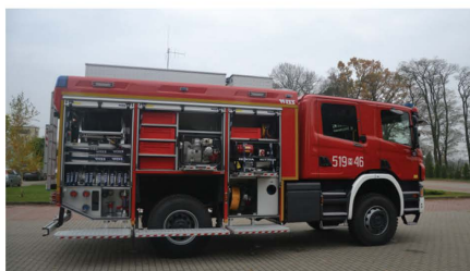
Wóz strażacki OSP Mrozy

Jeżeli do opisanych powyżej inwestycji dodamy jeszcze realizację takich projektów jak: remont Gminnego Centrum Kultury, przebudowa i remont targowiska