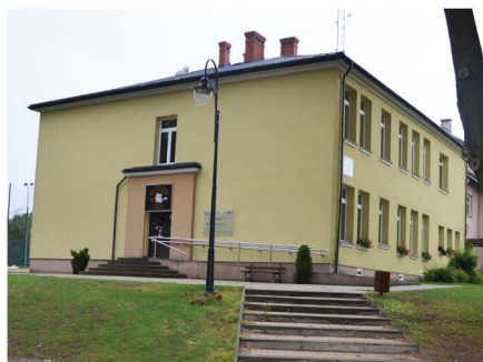
Remont wiejskiego budynku w centrum Grodziska