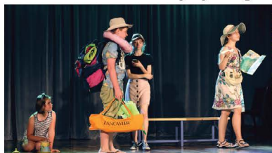
Zakończenie roku artystycznego