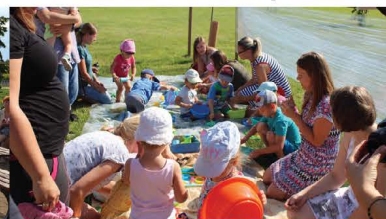
Promenada 2018 - Zmysłowisko