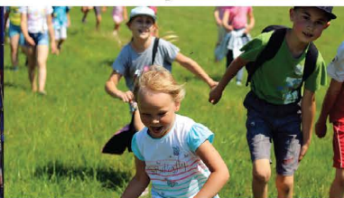
Wakacje w GCK