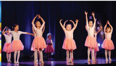
Nagranie filmu promocyjnego