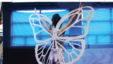
Spektakl „The Butterfly History”