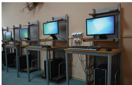
Przeciwdziałanie wykluczeniu cyfrowemu

Dzięki środkom unijnym udało się również wybudować infrastrukturę szerokopasmowego Internetu, a także wsparcie uzyskały grupy społeczne zagrożone wykluczeniem cyfrowym. W ramach projektu Przeciwdziałanie wykluczeniu cyfrowemu w Gminie Mrozy została wybudowana nowoczesna infrastruktura telekomunikacyjna umożliwiająca mieszkańcom dostęp do szerokopasmowego Internetu w przeważającej części gminy, a 65 gospodarstw domowych oraz 10 jednostek organizacyjnych gminy Mrozy otrzymało sprzęt komputerowy i dofinansowanie dostępu do Internetu w okresie od maja 2013 r. do grudnia 2020 r. Projekt zrealizowany za 2 756 231,98 zł został sfinansowany w 100% ze środków zewnętrznych.