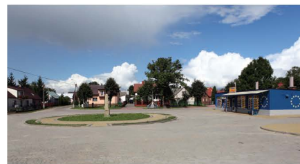
Rynek w Jeruzalu