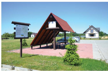
Postój dla turystów w Grodzisku