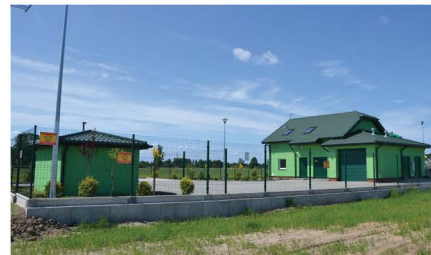
Oczyszczalnia w Jeruzalu

W okresie ostatnich lat jedną z ważniejszych inwestycji była budowa kanalizacji sanitarnej. Kanalizacja jest ważna dla mieszkańców, ale niestety jej budowa, szczególnie na obszarach wiejskich, jest bardzo kosztowna. Dlatego też tak istotne jest pozyskanie środków zewnętrznych na ten cel. W ramach unijnych programów naszej gminie udało się pozyskać dofinansowanie na takie przedsięwzięcia jak: Przebudowa oczyszczalni ścieków wraz z rozbudową kanalizacji sanitarnej w miejscowości Mrozy oraz Budowa oczyszczalni ścieków wraz z siecią kanalizacyjno-sanitarną w miejscowości Jeruzal oraz części miejscowości Łukówiec . Dzięki tym projektom sieć kanalizacyjną posiada cała miejscowość Mrozy i miejscowość Jeruzal oraz część sołectw: Łukówiec, Wola Rafałowska, Wola Paprotnia. Jej długość na koniec 2017 r. wynosiła łącznie 41,24 km i obejmowała ok. 1094 przyłączy. Funkcjonują także dwie gminne, mechaniczno-biologiczne oczyszczalnie ścieków, przebudowana – w miejscowości Mrozy o przepustowości 600 m 3 /d oraz nowa w Jeruzalu o przepustowości 110 m 3 /d.