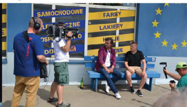
Pytanie na śniadanie w Jeruzalu