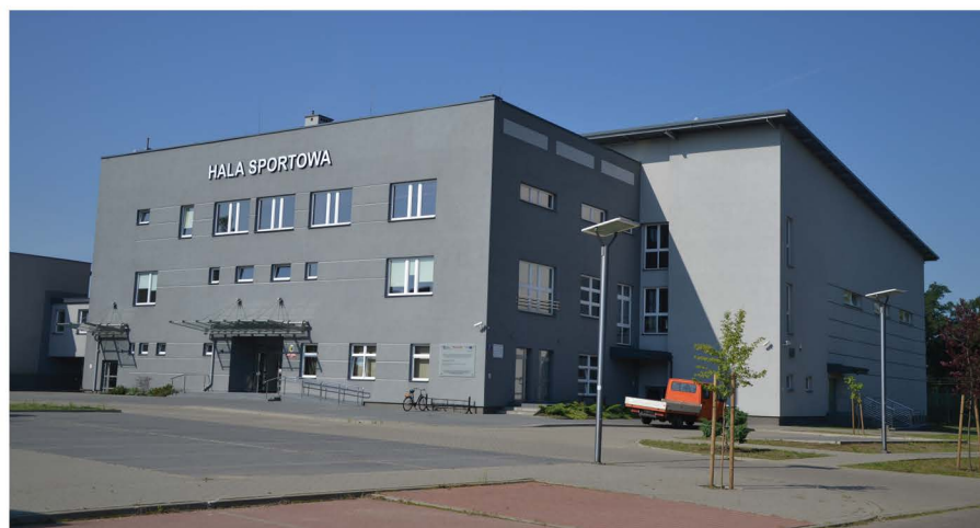
Hala sportowa w Mrozach

Kolejna priorytetowa inwestycja, długo wyczekiwana przez mieszkańców,