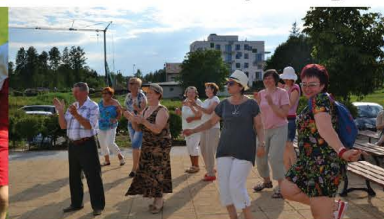
Promenada 2018 - kapela Jazgodki