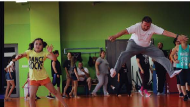
Indigo Dance Art - rodzice vs dzieci