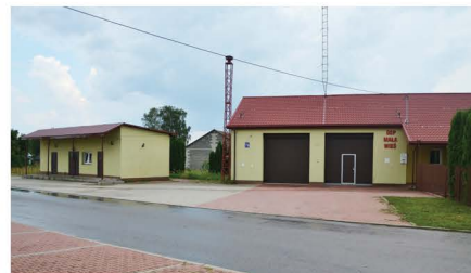
OSP Mała Wieś