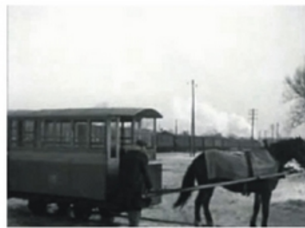
PKP „Nielubie-Warszawa” sp. z o.o. 1999

Przywrócenie kursów kolejki konnej łączącej Mrozy z Sanatorium w Rudce stanowi dobrą zachętę do odwiedzenia i bliższego poznania tej miejscowości. W związku z tym pozwalam sobie przybliżyć Państwu kilka istotnych epizodów z historii Rudki, a przede wszystkim Sanatorium, które obecnie funkcjonuje jako Samodzielny Specjalistyczny Zespół Zakładów Opieki Zdrowotnej.