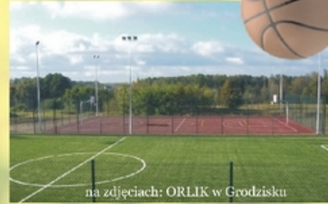
na zdjęciach: ORLIK w Grodzisku

Powoli kończy się rok, a wraz z nim realizacja wielu z wcześniej zaplanowanych inwestycji. Przede wszystkim do końca dobiegła budowa kompleksu boisk sportowych w Grodzisku w ramach rządowego programu „Moje Boisko – Orlik 2012”. Łączny koszt inwestycji wyniósł 1 037 854,98 zł , z tego 486 000 zł stanowią środki z Ministerstwa Sportu i Turystyki, a 333 000 zł pochodzą z budżetu Samorządu Województwa Mazowieckiego. W wyniku realizacji przedsięwzięcia powstały dwa nowoczesne boiska, w tym jedno wielofunkcyjne z nawierzchnią poliuretanową oraz drugie do gry w piłkę nożną z nawierzchnią z trawy syntetycznej. Dodatkowo przy boiskach został usytuowany funkcjonalny budynek szatniowo-sanitarny. Całość oświetla 10 specjalnych lamp. Obiekt prezentuje się wyjątkowo efektownie i już teraz stanowi atrakcyjne miejsce spędzania wolnego czasu dla dzieci i młodzieży z terenu Grodziska i okolic.