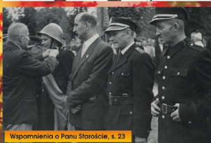
Wspomnienia o Panu Staroście, s. 23