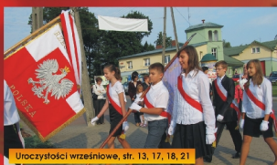
Uroczystości wrzesniowe, str. 13, 17, 18, 21