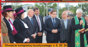
Otwarcie kompleksu kuracyjnego, s. 5, 20, 24