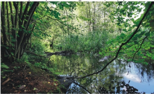
Leśne skarby z gminy Mrozy

W odległości około 1 km od rezerwatu „Rogoźnica”, w pobliżu wsi Borki, znajduje się torfowisko wysokie z oczkiem wodnym zarastającym pałąk szerokolistną. Na torfowisku rosną pojedynczo, bajkowo powykrywane sosny i brzozy. Wśród występujących tam roślin można zauważyć welniankę pochwowatą, welniankę wąskolistną, żurawinę białą oraz czernieł białą. Na terenie tym znajdują się także stanowiska masowo występującej, objętej ochroną całkowitą rosiczki okrągłolistnej, której liczba stanowisk w Polsce maleje z powodu likwidacji siedlisk. W bezpośrednim sąsiedztwie torfowiska znajduje się bór baglenny z borówką baglenną oraz chronionym częściowo bagnem zwyczajnym.