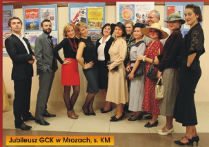
Jubileusz GCK w Mrozach, s. KM