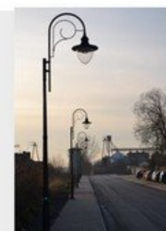
Projekt i budowa oświetlenia ulicznego na terenie gminy Mrozy – 73 540 zł