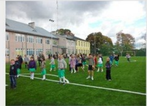
Budowa kompleksu boisk sportowych w Grodzisku w ramach programu „Moje Boisko – Orlik 2012” 1 037 855 zł