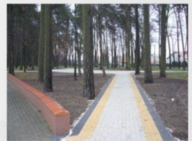
Budowa parku z elementami placu zabaw w Mrozach przy ul. Licealnej - 89 993 zł