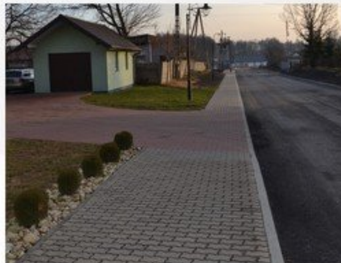
Budowa chodników w Mrozach (Ulice: Kolejowa, 3 Maja, Spółdzielcza, Willowa i Słoneczna) - 439 477 zł