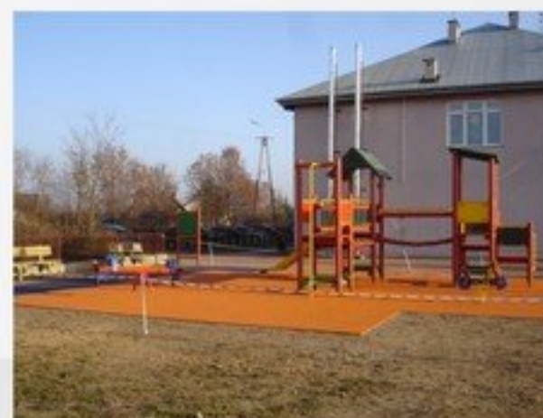
Budowa placów zabaw przy SP w Mrozach, ZS w Jeruzalu i SP w Grodzisku w ramach programu „Radosna Szkoła” – 328 574 zł