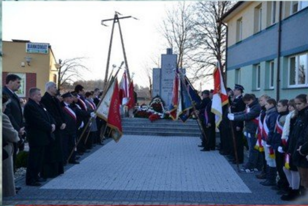
ŚWIĘTO NIEPODLEGŁOŚCI w gminie Mrozy