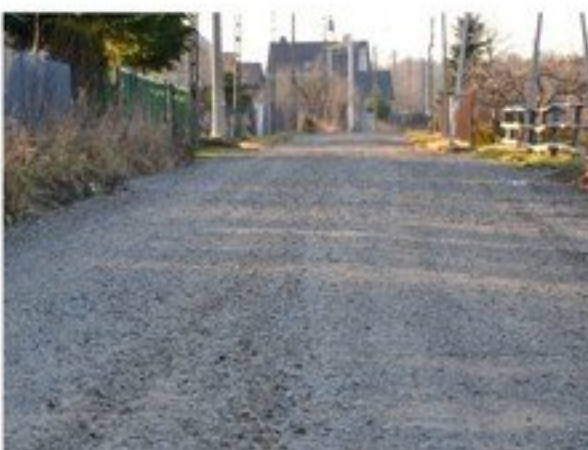
Budowa dróg tłuczniowych na terenie gminy - 186 000 zł