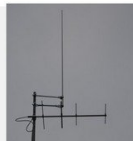
Zakup sprzętu radiowego dla OSP Mrozy – 10 000 zł