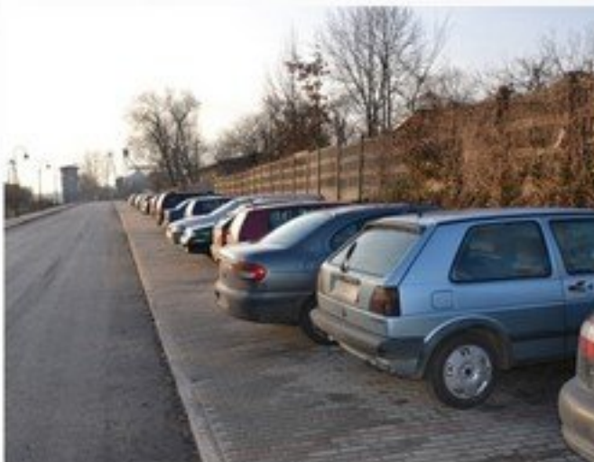
Budowa parkingów w Sokolniku, Trojanowie, Guzewie, Urzędzie Gminy w Mrozach i przy stacji PKP w Mrozach - 214 164 zł