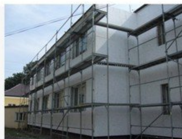
Termomodernizacja budynku internatu przy Zespole Szkół w Mrozach – 608 071 zł