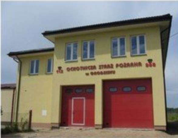
Rozbudowa budynku OSP Grodzisk – wartość 193 471 zł