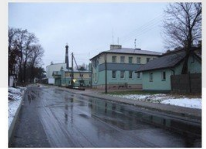
Budowa dróg i ulic asfaltowych w gminie Mrozy (Kotacz – Kol. Jeruzal, Płomieniec- Kotacz, w Łukówcu, Porzewnicy, ulic: B. Prusa, Św. Teresy, 3 Maja, Kolejowa, 200-lecia Mrozów, Górna) – 825 493 zł