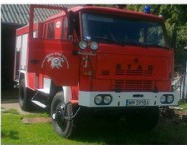
Zakup samochodu strażackiego dla OSP Grodzisk – 30 000 zł