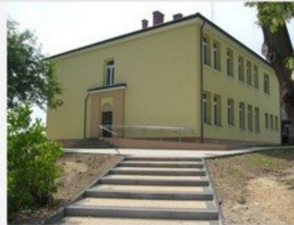
Remont wiejskiego budynku w centrum miejscowości Grodzisk wraz z oświetleniem placu – 277 845 zł