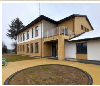
Budowa Domu Opieki Senioralnej w Lipinach