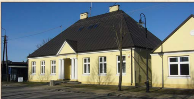
Budynek dawnego Urzędu Gminy w Jeruzalu

Rok 1918 przyniósł Polsce niepodległość, chociaż granice i terytorium kraju kształtowały się jeszcze ostatecznie do roku 1922. Ustrój samorządu lokalnego ustanowiony w 1864 roku został utrzymany. Jedyną większą zmianą było ustanowienie rad gmin i większa demokratyzacja praw wyborczych 3 . Pozostał nadal stary podział na powiaty i gminy. Powołano jedną nową strukturę – województwa w miejsce dawnych rosyjskich guberni. W sierpniu 1919 roku powołano województwo warszawskie wraz z powiatem mińskim, do którego należała gmina Kuflew i Łukowiec 4 . W 1923 r. zniesiono gminę Łukowiec i powołano w części jej obszaru nową gminę Jeruzal oraz gminę Wielgolas. Jedną miejscowość przyłączono do gminy Łatowicz 5 .