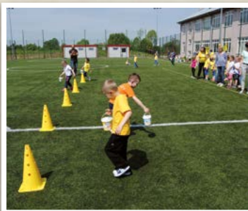
Gminna Mini Olimpiada Przedszkoli i klas I-III