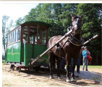
Tramwaj Konny Mrozy - Rudka