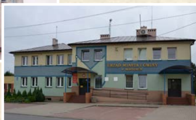
Urząd Miasta i Gminy Mrozy