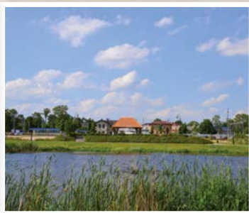
Park im. Piotra Starosty w Mrozach