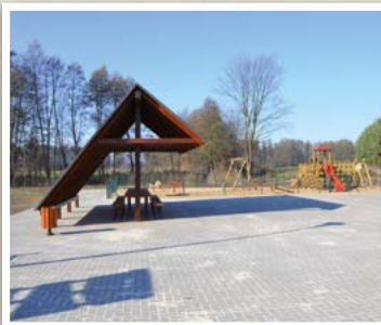
Punkt postoju turystów w Łukówcu