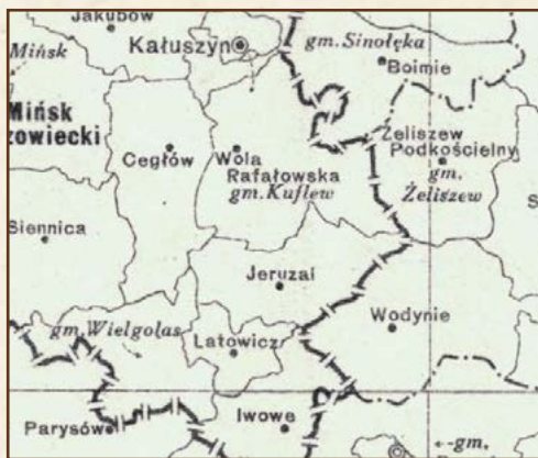
Fragment administracyjnej mapy z początku XX wieku

Pierwsze wybory wójtów, radnych gminnych i gromadzkich przeprowadzono na przełomie 1933 i 1934 roku, kolejne tuż przed wybuchem II wojny światowej.