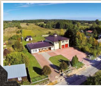
Ochotnicza Straż Pożarna w Grodzisku