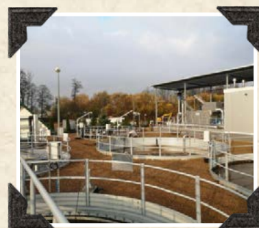
Oczyszczalnia ścieków w Mrozach 2022 r.