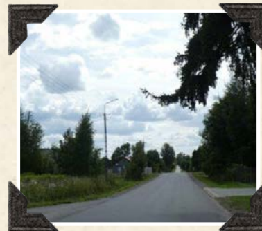
Droga w Sokolniku 2022 r.