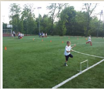
Boisko wielofunkcyjne „Moje Boisko – Orlik 2012” przy Zespole Szkół w Mrozach