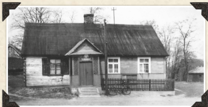
Budynek Gromadzkiej Rady Narodowej w Grodzisku

W 1975 r. Sejm PRL przyjął ustawę o dwustopniowym podziale administracyjnym państwa. Zlikwidowano jednostki administracyjne na szczeblu powiatowym. W zamian za to utworzono więcej ale mniejszych województw – w sumie 49. Gmina Mrozy weszła w skład województwa siedleckiego, do którego należała do 1998 r.