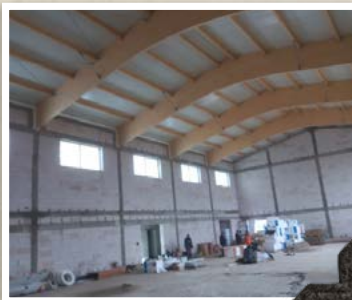
Budowa hali sportowej przy Szkole Podstawowej w Grodzisku