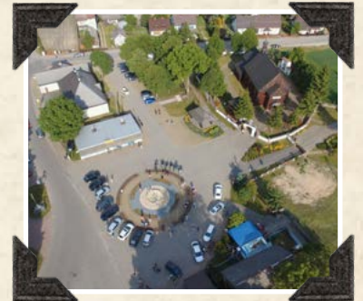
Rynek w Jeruzalu 2020 r.