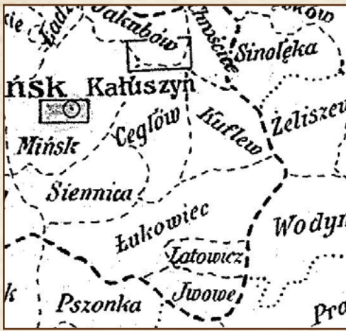
Fragment administracyjnej mapy z początku XX wieku

Gminy Kuflew i Łukowiec (Łukówiec) wchodziły w skład guberni warszawskiej, powiatu mińskiego. W 1868 roku zmieniono nazwę powiatu mińskiego na nowomiński.