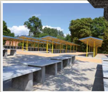
Targowisko w Mrozach