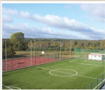
Boisko wielofunkcyjne „Moje Boisko – Orlik 2012” przy Szkole Podstawowej w Grodzisku