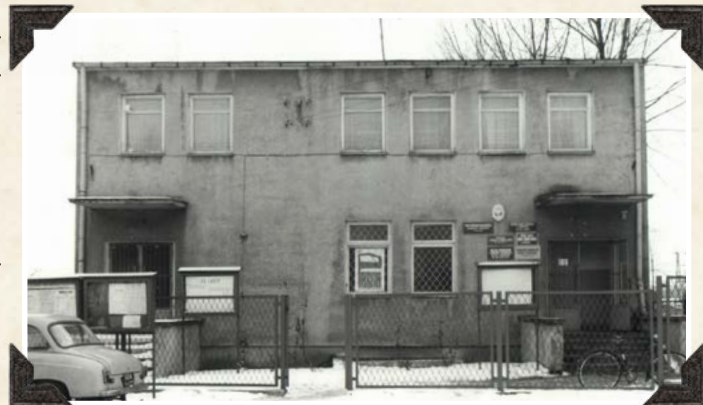
Budynek Urzędu Gminy w Mrozach w latach 70-tych XX w.

Gminy powróciły do administracyjnej rzeczywistości w 1973 roku. W tym roku też narodziła się gmina Mrozy w granicach znanych do dzisiaj. Została utworzona z gromad w Jeruzalu, Kuflewie i Mrozach, z terenów, z dawnych gmin w Kuflewie i Jeruzalu. Na siedzibę gminy została wybrana miejscowość Mrozy, która choć peryferyjne położona względem pozostałego obszaru gminy, już wtedy posiadała naj-