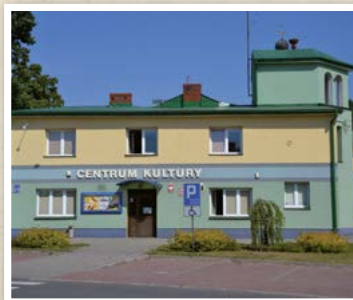
Gminne Centrum Kultury w Mrozach