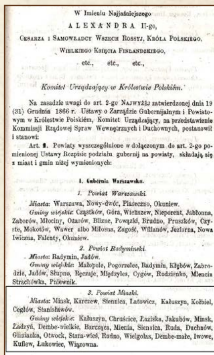
Ukaz carski z 1867 r. powołujący gminy

Z uwagi na to, że nie było budynków urzędów gmin, jak to ma miejsce obecnie, siedziba gminy była tam, gdzie mieszkał jej wójt. Siedzibą gminy Kuflew została Wola Rafałowska, nazywana również Budami. Siedziba gminy Łukowiec (Łukówiec) znajdowała się w Latowiczu.