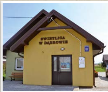
Świetlica w Dąbrowie