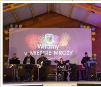
Nadanie praw miejskich