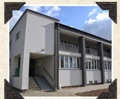
Ośrodek zdrowia w Jeruzalu 2022 r.