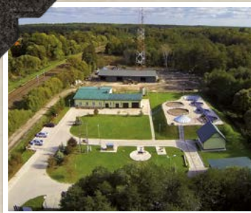
Zakład Gospodarki Komunalnej i Oczyszczalnia Ścieków w Mrozach