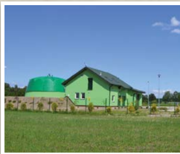
Oczyszczalnia Ścieków w Jeruzalu