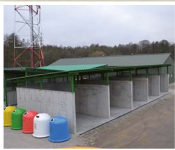
Punkt Selektywnej Zbiórki Odpadów Komunalnych w Mrozach