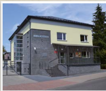
Gminna Biblioteka Publiczna w Mrozach