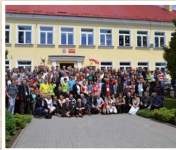
Ogólnopolski Zjazd Opiekunów Szkolnych Pracowni Internetowych w Mrozach