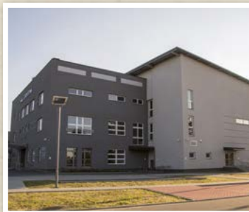
Wielofunkcyjna Hala Sportowa w Mrozach